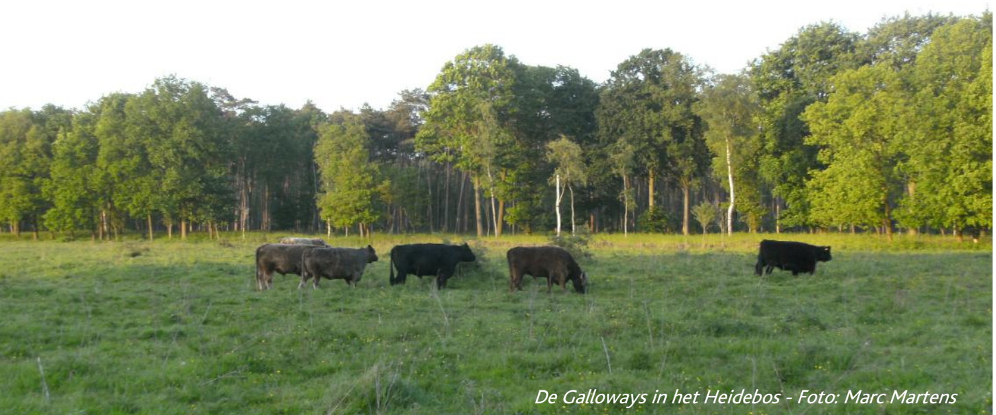
De Galloways in het Heidebos

Voorzitter Natuurpunt Moervaart-Zuidlede